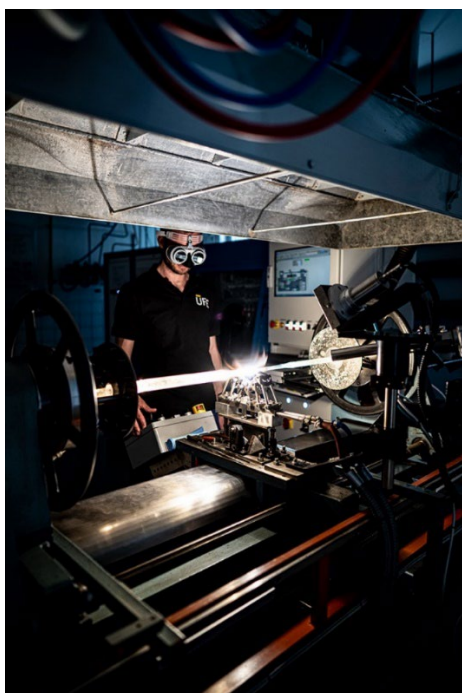
Foto 1: Sklářský soustruh pro přípravu preformy optického vlákna, tyčinky z křemenného skla o průměru cca 1 cm, ze které se pak vytáhne optické vlákno o průměru srovnatelném s lidským vlasem.