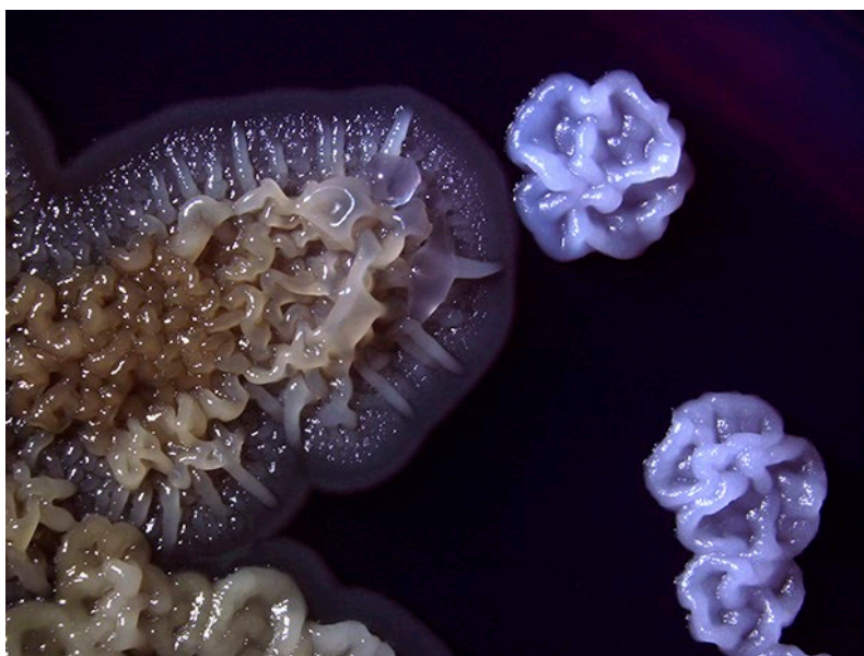
Foto 3: Biofilmy, povlaky a kolonie představují hlavní formy výskytu mikroorganismů na různých površích. Na fotografii jsou kolonie mikroorganismů rostoucích na médiu s pH indikátorem, takže jsou výrazně barevnější než za obvyklých růstových podmínek. Pro účinné řešení problémů spojených s těmito mnohobuněčnými strukturami, je nezbytné porozumět základním principům jejich tvorby a vývoje, což má zásadní význam jak pro základní výzkum, tak pro praktické aplikace v průmyslu či medicíně.