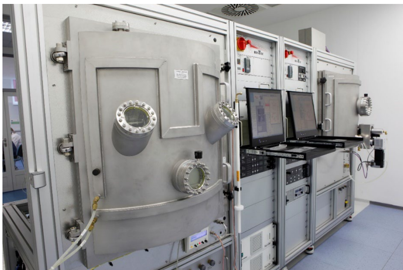
Foto 6: Ústav fyziky plazmatu AV ČR – TOPTec / Komora pro depozici tenkých vrstev