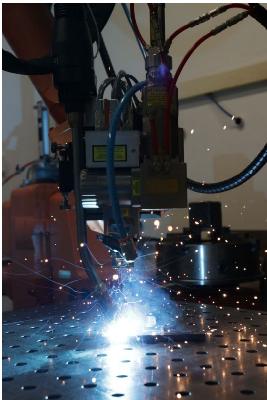
Foto 4: Ústav přístrojové techniky AV ČR / Vyvíjená aplikační hlava pro nový druh technologie hybridního svařování Laser-MIG