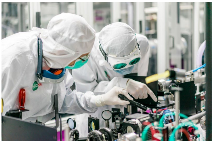
Foto 2: Fyzikální ústav AV ČR – Centrum HiLASE / Experimentální platforma pro vývoj tenkodiskových laserů